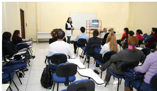
Alunos procuram caminhos para a empregabilidade