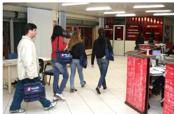
Estudantes chegam para um período de aulas

mento. Exemplo disso foi a criação do curso técnico em Qualidade, dos cursos profissionalizantes de Logística e Departamento Pessoal, e dos cursos de 3D Studio Max e Solid Works, que fazem parte do projeto da escola. Nesta página, depoimentos que sublinham o diferencial da Educaville na educação profissional.