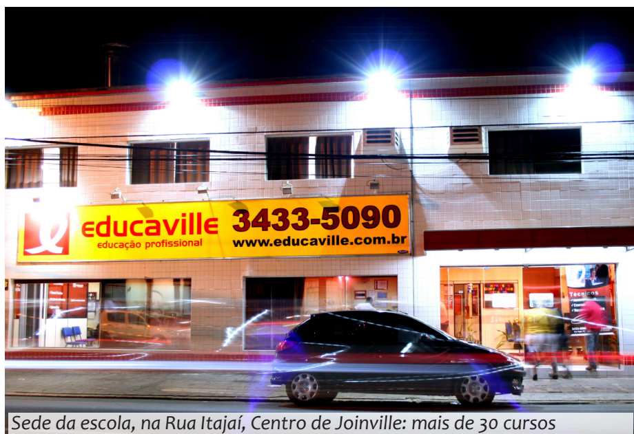
Sede da escola, na Rua Itajaí, Centro de Joinville: mais de 30 cursos